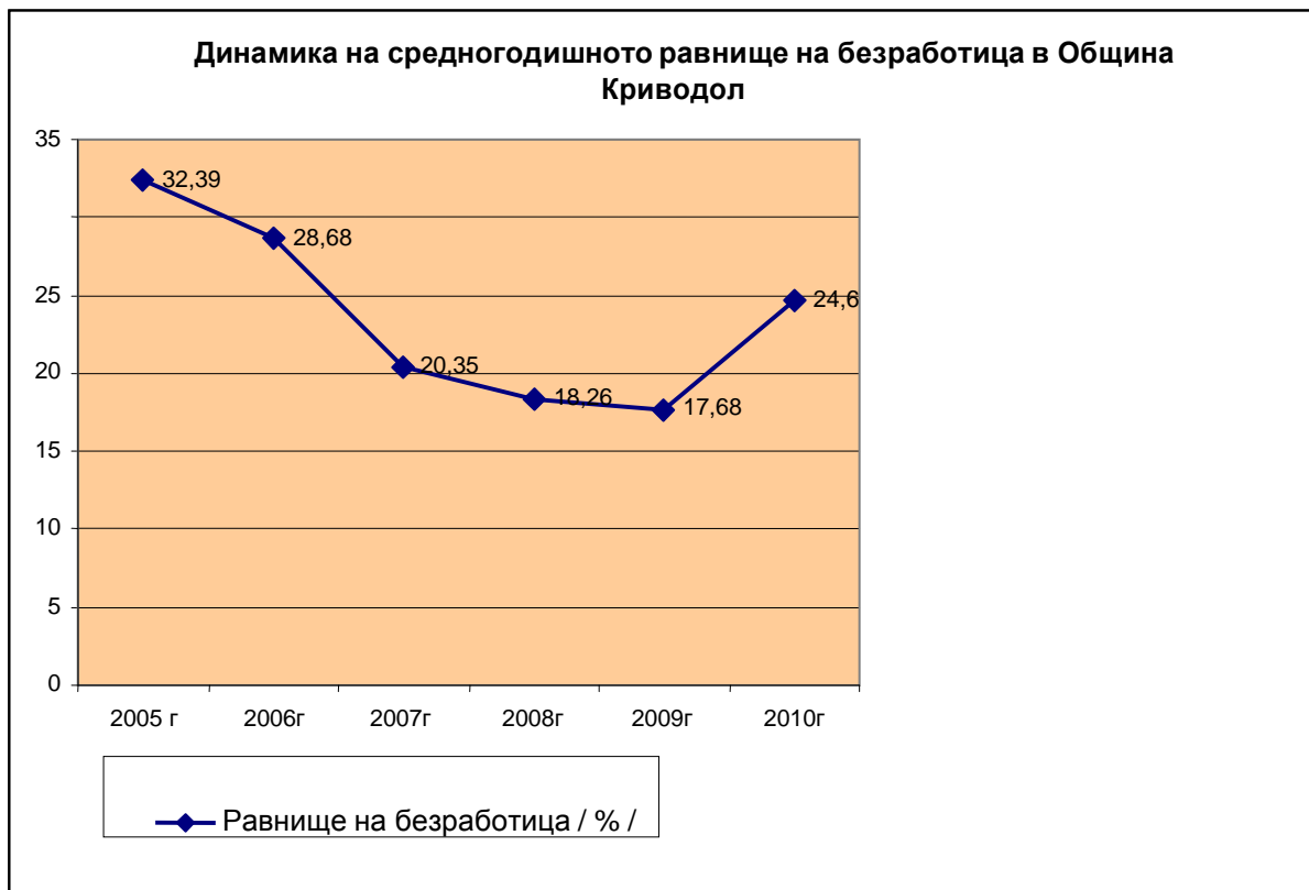
Фигура 5. Динамика на средногодишното равнище на безработица в община Криводол за 2005-2010 г.

Източник: Дирекция „Бюро по труда” - Враца