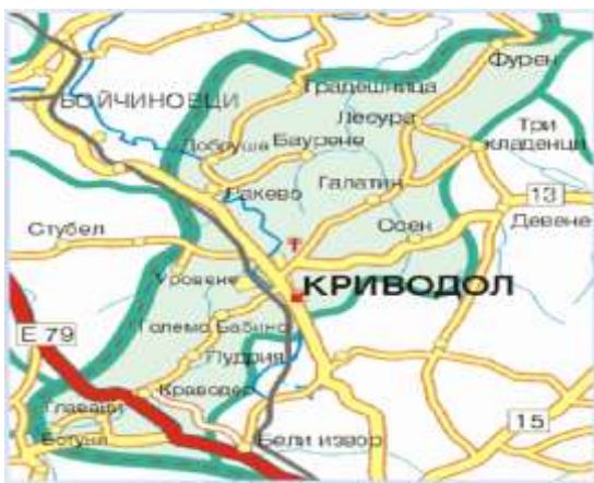
Фиг. 1: Карта на община Криводол

Община Криводол заема площ от 326.86 и е разположена в Северозападна България (Северозападен район за планиране), в границите на Врачанска област. Територията на общината съставлява 8,6 % от площта на област Враца и 3,1 % от територията на Северозападния район за планиране. Община Криводол граничи на северозапад с община Бойчиновци, на запад с