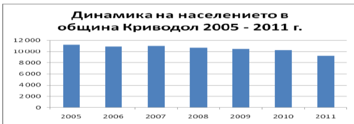
Фигура 2: Динамика на населението в община Криводол 2005 – 2011 г.