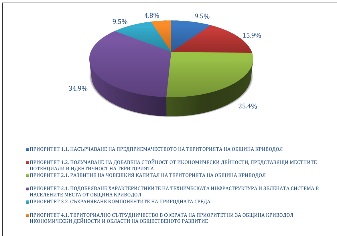
Фигура 1 Структура на планираните средства по приоритети на ПИРО спрямо общия размер